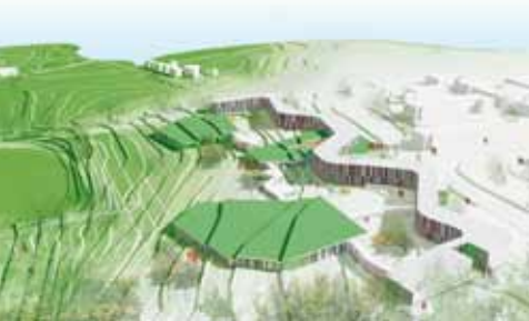
Retspsykiatrisk afdeling øst.

De nye bygninger skal fungere som naturlige afgrænsninger af udendørsarealerne. Patienterne får dermed en mindre restriktiv adgang til udendørsarealer, som ikke er omkranset af hegn og mure. Begge de retspsykiatriske afdelinger vil blive indrettet med omfattende aktivitetsmuligheder, blandt andet køkkenfaciliteter, træningslokaler og undervisningslokaler.