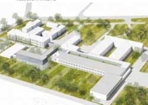
Ny hovedindgang og tilbygning.