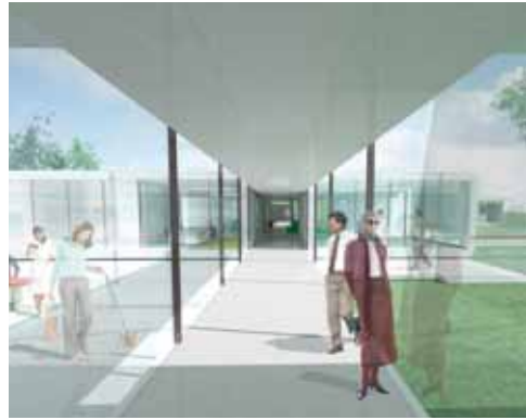
Ny mellembygning fra eksisterende sengebygning.