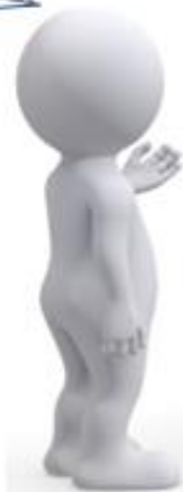
Mikrobiolog, farmaceut, infektionsmediciner...

Jeg synes du skal ændre din antibiotikaprofylakse fra cefuroxim til cloxacillin