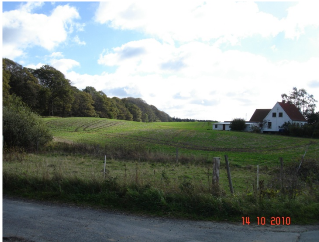
Store Dyrehave skovbryn i landskab med små bakker