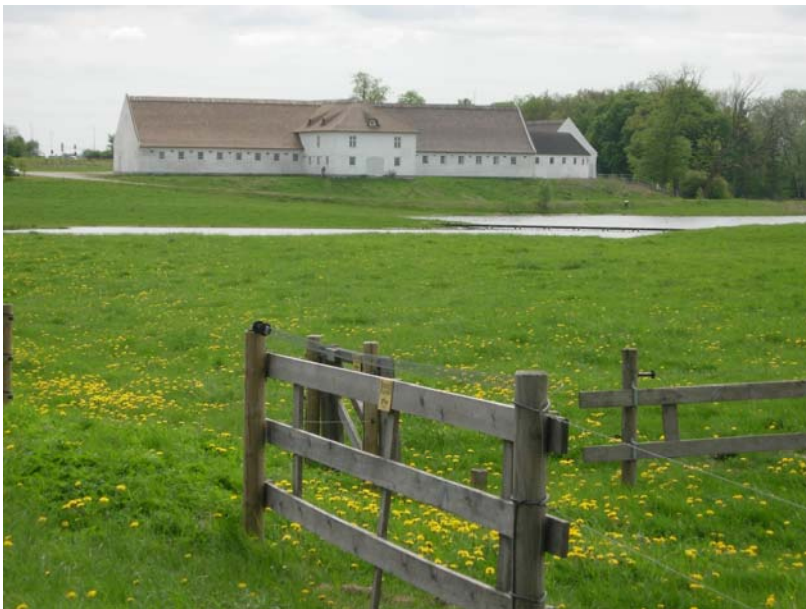
Vådområde ved Favrholt

Vådområdet Salpetermosen er et større tilgroet moseområde, hvor der har været gravet tørv. Området indeholder både naturværdier og kulturværdier, sidstnævnte bl.a. grundet fund af spor af den tidligste befolkning i området.